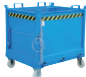
Typ FB mit Rollen