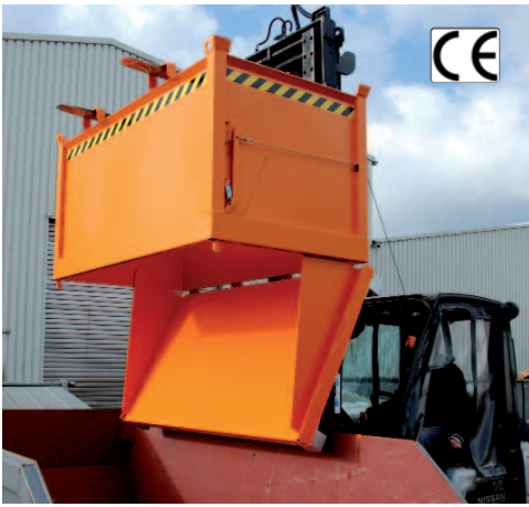
Typ FB mit Zentrierwänden und geöffneter Bodenklappe